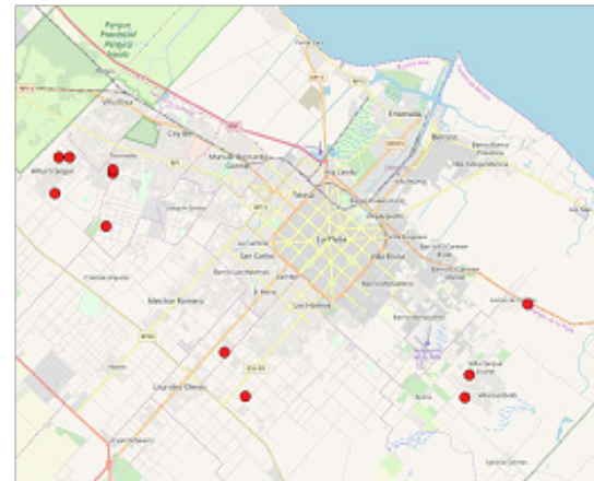
Figura 2. Ubicación de los barrios generados por la “Vía 2” de la ordenanza N° 11.094/13.

La Plata es una ciudad com-fusa (Abramo, 2012) con un casco fundacional densificado —aloja el 37,7% de