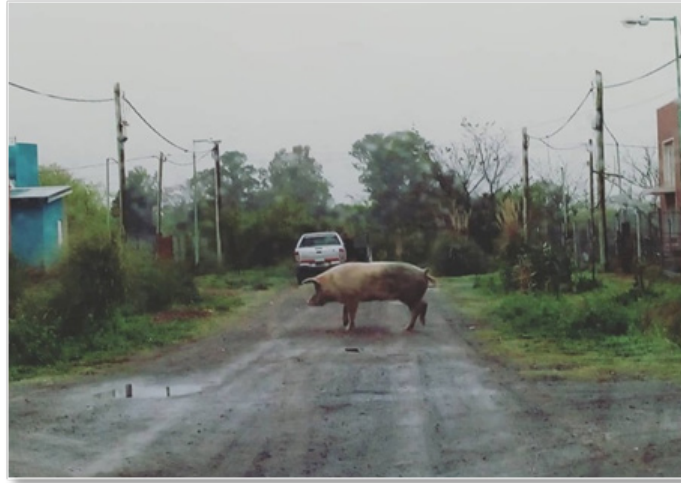
Figura 1. Barrio generado mediante la "Vía 2". Fuente: foto cedida por una beneficiaria del PROCREAR, septiembre de 2019.

sabido que el temor y los relatos en torno a la peligrosidad son un principio urbanístico, constituyéndose la geografía del miedo 18 en un proceso activo en la producción del espacio urbano (Carrión Mena & Núñez-Vega, 2006). Ahora bien, independientemente de la instrumentalización (y producción) económica del temor, su particular componente psicológico hace que, una vez que estos imaginarios se echan a andar, operen sistemáticamente en las decisiones individuales de los/as usuarios/as de la ciudad. Si bien para algunos/as de nuestros/as entrevistados/as el peligro se asociaba a lugares ubicados en "las afueras de la ciudad", la mayoría de los loteos generados por la "Vía 2" se ubicaron allí. Esto es así porque, lo que volvía seguro a un territorio era "la sapiencia de quiénes van a conformar el futuro barrio" 19 , siendo constantes las apelaciones a que podrían confiar en sus nuevos/as vecinos/as y estar seguros/as junto a ellos/as, aun sin conocerlos/as con anterioridad.