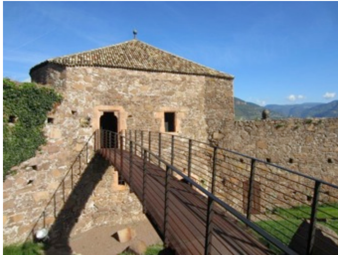
Figura 15 - Las pasarelas de hierro recuerdan a las vías ferratas dolomíticas

La primera torre aborda la historia del castillo Firmiano, ilustrando acerca de los pormenores de su puesta en valor. Los temas de las muestras permanentes cubren un amplio espectro de formas de “encuentro del hombre con la montaña” que va desde la historia del alpinismo occidental hasta las figuras prominentes en la religiosidad Himalayana: la torre norte está dedicada a la religiosidad de montaña y en ella se exhiben vinculadas a la figura del yogi Milarepa y del venerable Guru Rinpoche. La torre Este exhibe cuadros y mapas vinculados a cerros que son meca de la escalada deportiva, incluyendo el Matterhorn, el Gran Capitán, el Cerro Torre y las Dolomitas. La torre Oeste está dedicada a “las siete cumbres” y “los catorce ochomiles”.