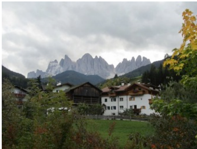
Figura 3 - Arquitectura vernácula y paisaje dolomítico en Val di Funes

Las Dolomitas son mundialmente conocidas porque sus abruptas laderas calcáreas “empalidecen” y “enrojecen” ante la salida y la puesta del sol, al decir de los habitantes locales. Las Dolomitas han sido recientemente incorporadas a la lista del Patrimonio Mundial de la UNESCO en virtud de la majestuosidad de su paisaje montañoso y de la singularidad de su cultura (Figura 3).