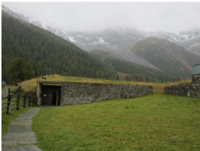
Figura 8 - Construcción semi-subterránea del Museo Ortles al pie de los Alpes

Las actividades de extensión a la comunidad son cada vez más numerosas y la autora ha tenido oportunidad de participar de jornadas que incluían una caminata matutina a una malga pastoril guiada por el propio Messner (a la que concurrieron unas cincuenta personas) y una conferencia vespertina, que congregó a más de cuatrocientos asistentes.