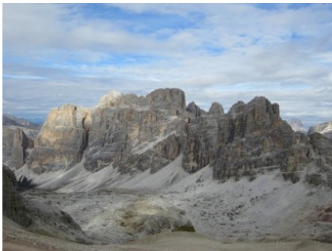
Figura 1 - Las Dolomitas vistas desde lo alto

Entre los atractivos culturales de la región se cuentan más de 800 fortalezas, abadías y castillos medievales, muchos de los cuales han sido convertidos en museos. En el interior del castillo de Roncolo en Bolzano, se puede apreciar uno de los conjuntos de frescos medievales seculares mejor conservados de Europa. En las inmediaciones del centro termal de Merano, el castillo de Tirolo alberga las colecciones del Museo Histórico de Sud Tirolo (Figura 2). El más destacado Museo de Cultura Ladina se encuentra albergado en el castillo medieval de San Martín de Badia; en tanto que en San Teodoro se emplaza un magnífico Museo Etnográfico con sus colecciones de trineos, carruajes para nieve, cetras, pipas, fajas y estufas de cerámica, además de las reconstrucciones in situ de graneros y cabañas propias de la arquitectura vernácula tirolesa.