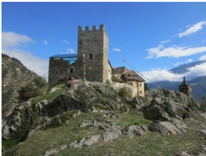
Figura 12- MMM Juval es residencia y museo dedicado al mito de la montaña

El castillo de Juval puede ser accedido exclusivamente en el marco de visitas guiadas en italiano y en alemán. El acceso a la cima de la colina se realiza a través de un chorten de estilo tibetano que da la bienvenida con la misiva “paz y felicidad”. Un primer cartel explica al visitante la naturaleza sagrada de Juval como lugar “fuerte”, pleno de poder espiritual, que debe ser recorrido respetuosamente en sentido anti-horario, tal como se estila en las peregrinaciones de circunambulación de las montañas sagradas de los Himalayas por parte de los practicantes del chamanismo Bon.