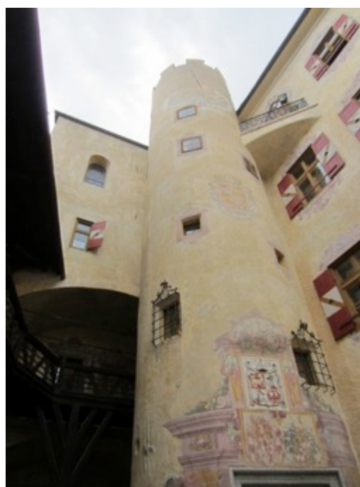
Figura 6 - Interior del MMM Ripa dedicado a las culturas de montaña