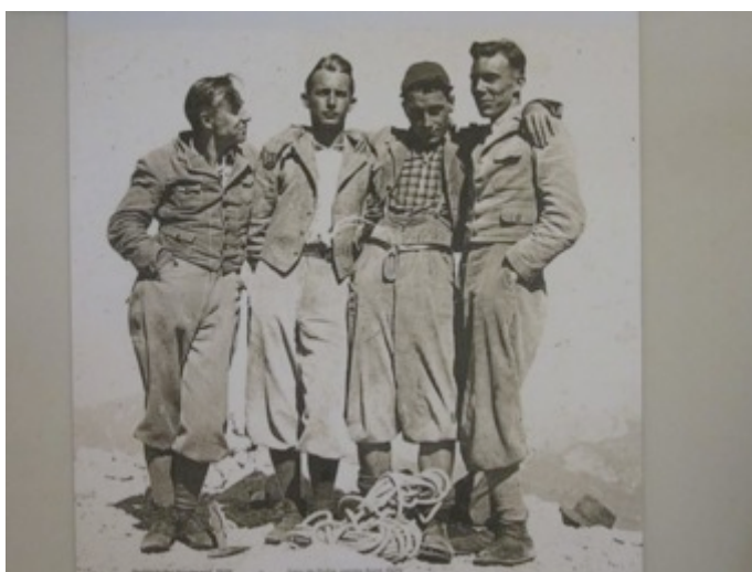
Figura 11 - La historia de la escalada en roca en antiguas fotografías

En él se expone una importante colección de pinturas y grabados sobre las Dolomitas y se rinde homenaje a distintos escaladores tiroleses que descollaron en la historia del alpinismo regional. Entre las piezas exhibidas se cuentan martillos, mosquetones y cuerdas para escalada en roca; así como fotografías y otros documentos históricos (Figura 11).