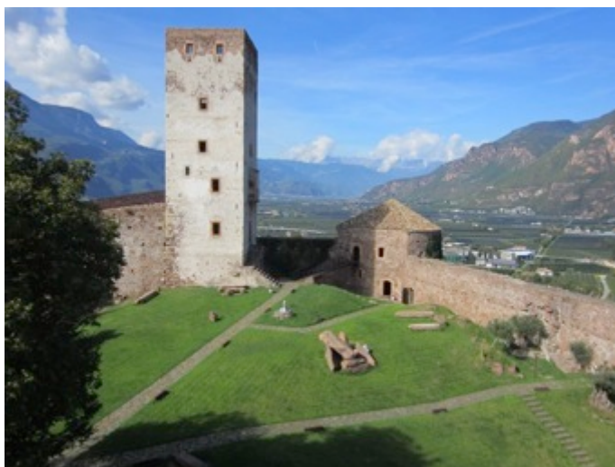
Figura 14 - El MMM Firmian está situado entre los Alpes y las Dolomitas

Las ruinas del castillo se encontraban en avanzado estado de abandono hasta que Messner logró convencer a las autoridades gubernamentales de Sud Tirol de colaborar en la financiación de su restauración, comprometiéndose a proveer al montaje de un museo dedicado a la temática del encuentro del hombre con la montaña. Tras superar innumerables obstáculos burocráticos, el MMM Firman abrió sus puertas en 2006. Funciona actualmente como sede administrativa y nodo central del sistema de los Messner Mountain Museums .