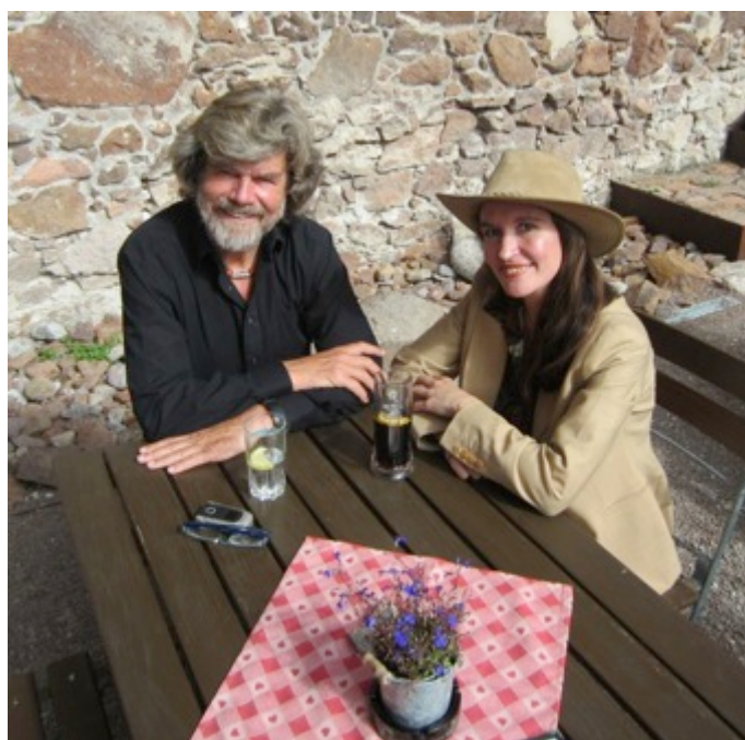
Figura 4 - Reinhold Messner y Constanza Ceruti en el MMM

Los Museos de Montaña fundados por Messner abordan respectivamente la escalada en roca, las culturas de los pueblos de altura, la mitología, el montañismo y las exploraciones en el hielo. Dichos establecimientos museísticos se articulan en forma armónica con el paisaje de las Dolomitas y los Alpes Orientales, contribuyendo a la educación patrimonial de la comunidad y al desarrollo sustentable de Sud Tirol a través de la promoción del turismo y el apoyo a los emprendimientos locales. Messner no ha dudado en caracterizar al proyecto como su “ quinceavo ochomil ”, manifestando que le ha dedicado gran parte de sus esfuerzos y recursos en los últimos años (Figura 4).