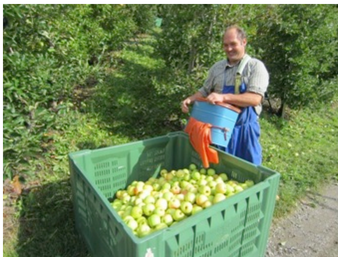
Figura 16 - Recolección de manzanas en las terrazas de Juval

Por último cabe mencionar que la sala de exhibiciones temporarias ofrecía en Octubre de 2013 una muestra fotográfica documental de la retracción de los glaciares en las montañas del Cáucaso. En 2014, la muestra estaba dedicada a la carrera de Messner, en ocasión de celebrarse su septuagésimo cumpleaños. En 2015, la muestra titulada “Montes en Guerra” se adelantó a otras iniciativas museísticas desarrolladas a lo largo de los Alpes con motivo del centenario de la Primera Guerra Mundial.