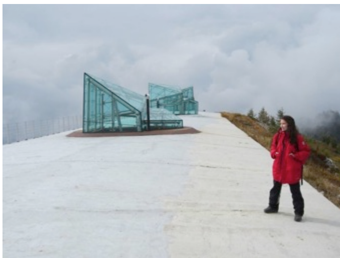
Figura 10 - Situado a 2000 m de altitud, el MMM Dolomitas

En él se expone una importante colección de pinturas y grabados sobre las Dolomitas y se rinde homenaje a distintos escaladores tiroleses que descollaron en la historia del alpinismo regional. Entre las piezas exhibidas se cuentan martillos, mosquetones y cuerdas para escalada en roca; así como fotografías y otros documentos históricos (Figura 11).