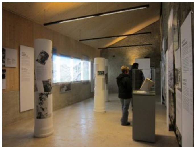
Figura 17 - Muestra temporal sobre historia del alpinismo tiroles