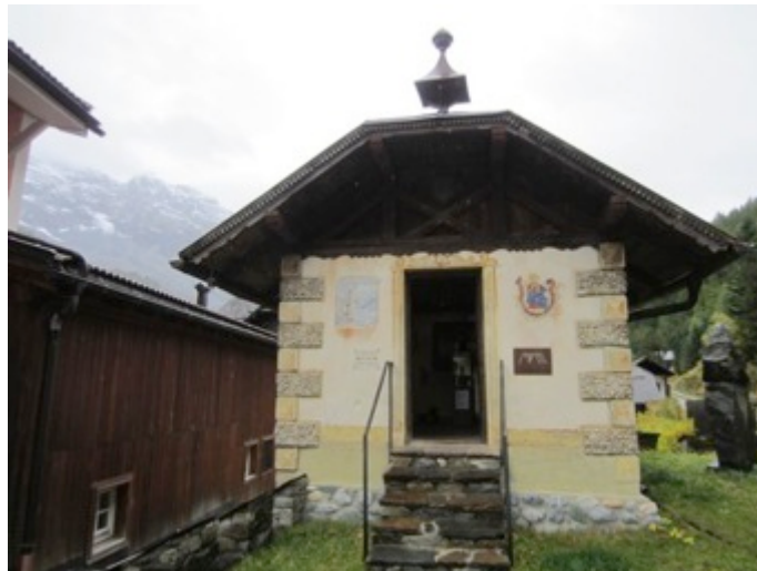
Figura 9 - Cabaña tirolesa que alberga el MMM Alpine Curiosa

A menos de un kilómetro de distancia del MMM Ortles se encuentra el pequeño museo denominado MMM Alpine Curiosa , situado en una minúscula cabaña de madera de típico estilo alpino que antaño era utilizada por los escaladores como refugio para sus ascensiones a los picos de la zona (Figura 9). Es testimonio de la temprana inquietud de Messner por la historia del montañismo y de sus primeros atisbos en lo referente al coleccionismo. Ofrece una selección de grabados, fotos antiguas y equipamiento para escalada, expuestos en vitrinas de vidrio que ocupan íntegramente una única sala, de acceso libre y gratuito.