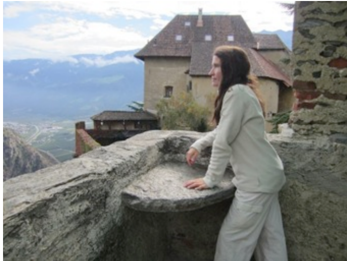
Figura 18- Vista desde la torre de Juval

artística de pintores locales o admiran la creatividad de los arquitectos que intervinieron en la restauración de los castillos (Figura 18).