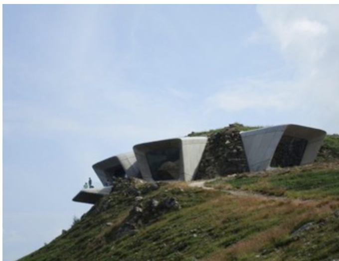
Figura 20 - El MMM Corones