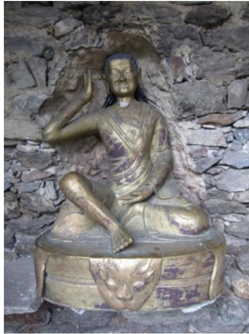
Figura 13 - Estatua tibetana del Yogi Milarepa en el castillo de Juval

El acceso al interior del castillo se realiza a través de la “bodega de expedición”, que alberga decenas de pares de botines, piolets, crampones, tiendas de campaña y demás objetos utilizados por Messner en sus expediciones alpinas y de exploración; entre ellos la cámara filmadora con la que documentó el primer ascenso a la cima del Everest sin la ayuda de oxígeno artificial. La planta superior de Juval alberga una vasta biblioteca sobre temas de montañismo y escalada. La importancia histórica del castillo queda en evidencia ante el imponente salón comedor, ambientado a la usanza medieval. Por su parte, la torre más alta está dedicada a las montañas mitológicas del mundo, comprendiendo una muestra de pinturas que representan a Fuyiyama, Uluru y el Monte Kailash. La cartelería que las acompaña ostenta frases que ayudan a profundizar la reflexión sobre las diferentes formas de veneración de las montañas sagradas por los distintos pueblos que habitan a sus pies.