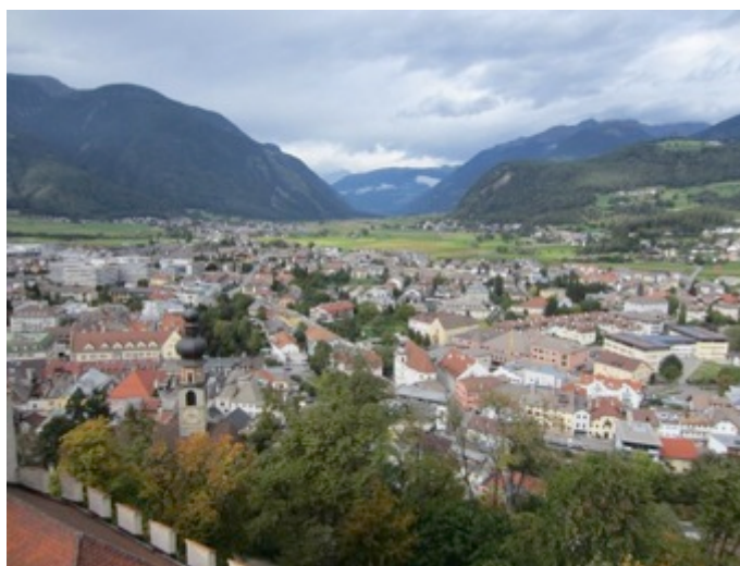
Figura 5 - Vista panorámica desde la torre del castillo de Brunico

rural se hallan excelentemente preservados en numerosos masos y malgas . Hacia Pustería descende el valle alpino de Badía, en el cual se sitúan numerosas aldeas ladinas, incluyendo San Martino, Badia, Colfosco y Corvara. En este entorno prístino se sitúa el MMM Ripa, dedicado a la cultura de los pueblos de montaña. Dicho museo se encuentra albergado en el interior de un castillo medieval situado sobre una colina. El castillo de Brunico funcionaba antiguamente como palacio episcopal y residencia estival de las autoridades del clero tirolés (Figuras 5 y 6).