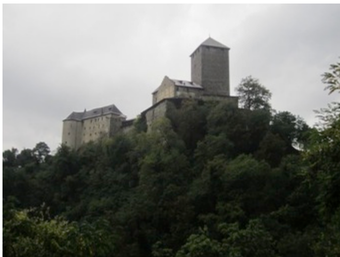
Figura 2 - El castillo de Tirolo sed del Museo Histórico de Sud Tirolo

Entre los atractivos culturales de la región se cuentan más de 800 fortalezas, abadías y castillos medievales, muchos de los cuales han sido convertidos en museos. En el interior del castillo de Roncolo en Bolzano, se puede apreciar uno de los conjuntos de frescos medievales seculares mejor conservados de Europa. En las inmediaciones del centro termal de Merano, el castillo de Tirolo alberga las colecciones del Museo Histórico de Sud Tirolo (Figura 2). El más destacado Museo de Cultura Ladina se encuentra albergado en el castillo medieval de San Martín de Badia; en tanto que en San Teodoro se emplaza un magnífico Museo Etnográfico con sus colecciones de trineos, carruajes para nieve, cetras, pipas, fajas y estufas de cerámica, además de las reconstrucciones in situ de graneros y cabañas propias de la arquitectura vernácula tirolesa.