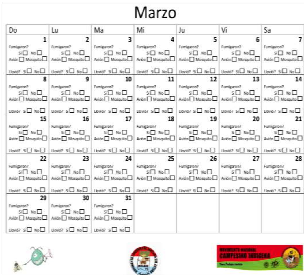
Figura 2. Calendario de registro de fumigaciones.