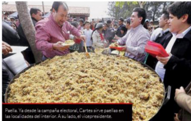
Paella. Ya desde la campaña electoral, Cartes sirve paellas en las localidades del interior. A su lado, el vicepresidente.

Última Hora (2013), "Cartes afirma que guerra en el Norte es contra ausencia del Estado", Asunción, 25/8. Disponible en www.ultimahora.com.py [visitado en abril 2017].